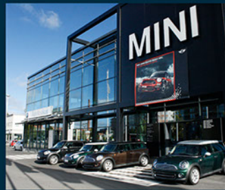
Myyvälän portti, Tampere