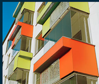
Parvekkeet, Helsinki Muurikuja