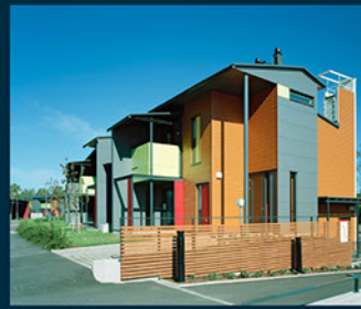
Seinät, Espoon Hansarinne