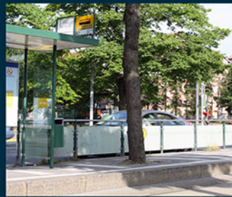
Raitioväylien aidat, Helsinki